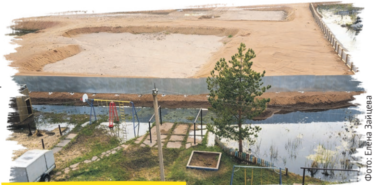
Стройплощадка в Котельниче

«Как вообще такое может быть? Те школьные долго-строи, которые то ли будут когда-то сданы, то ли нет, – за какие средства мы собираемся доставлять? Если за областные, то сколько еще нужно денег, чтобы люди, наконец, дождались обещанного? Ведь тут сроки вышли даже за рамки народной поговорки «Обещанного три года ждут»».