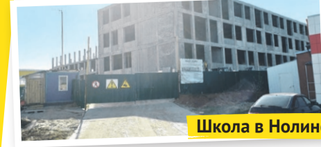
Школа в Нолинске