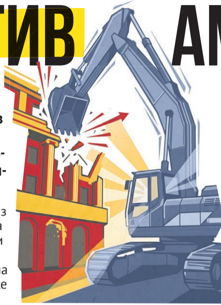
Иллюстрация: Алексей Беленёв