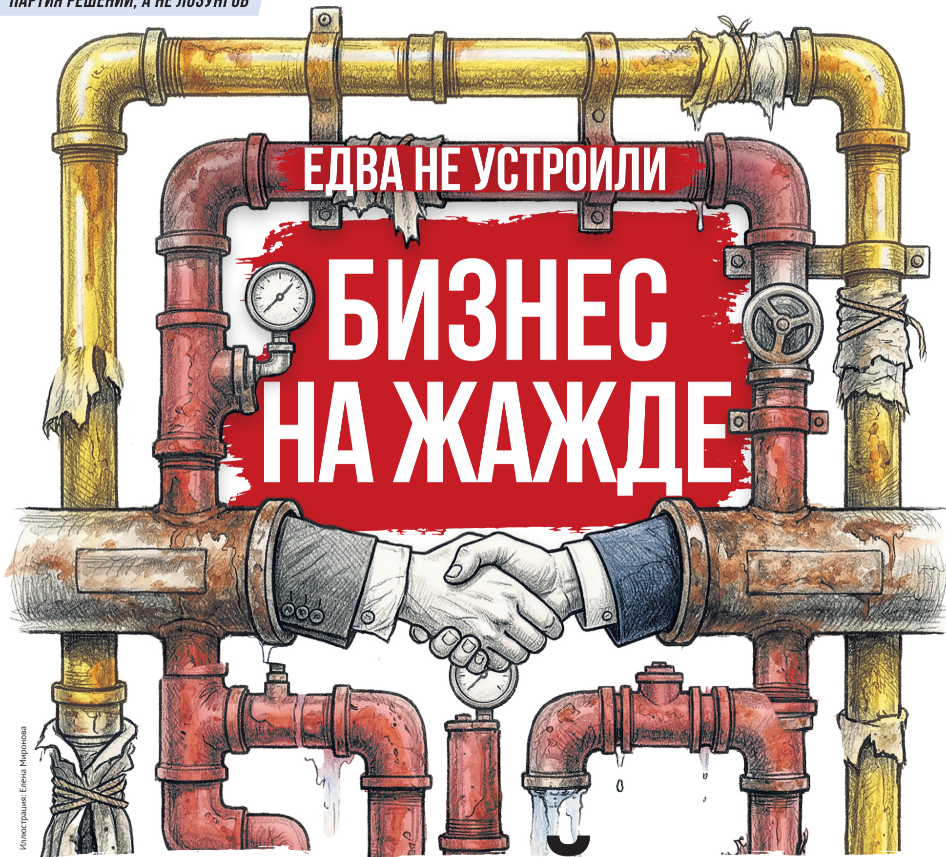
Иллюстрация: Елена Миронова