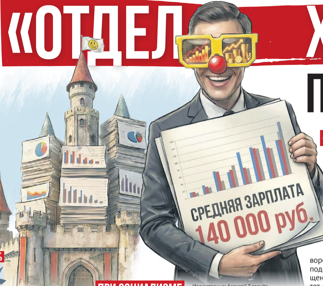
Иллюстрация: Алексей Беленев