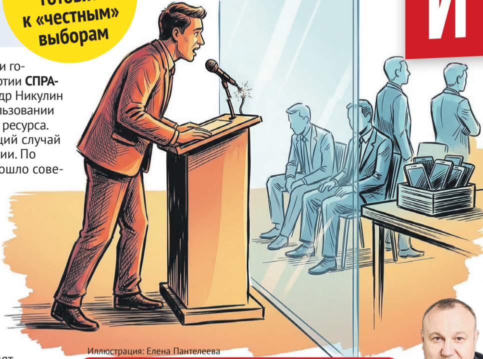
Иллюстрация: Елена Пантелеева

Цинизм ситуации зашкаливает. Когда депутаты-социалисты находят средства на ремонт, покупают оборудование для соцобъектов и латают дыры в бюджете за свой счет – власти молчат и благоосклонно принимают помощь. Но как только дело доходит до прямого общения с людьми, чиновники выставляют перед справедливороссами железный занавес.