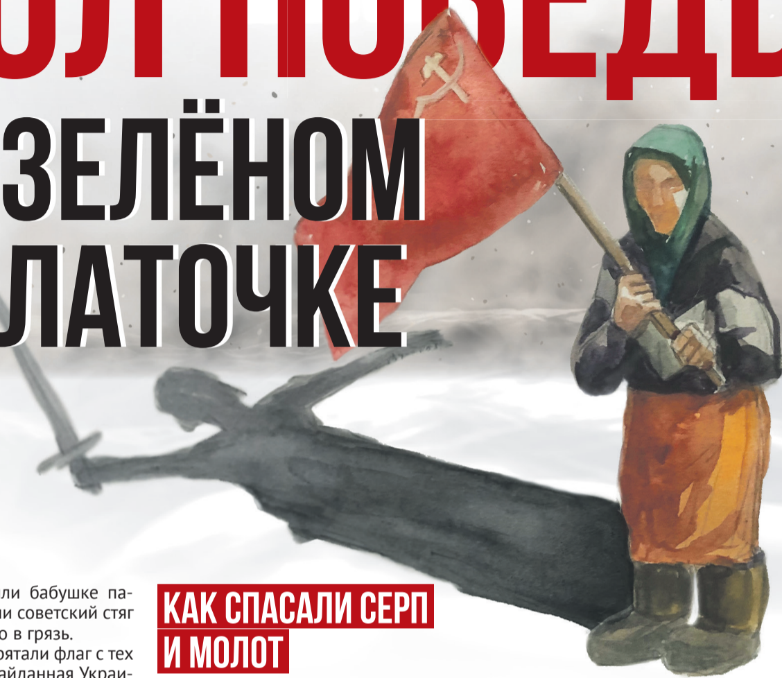
Рисунок Елены Рябоваловой, коллаж Алексей Беленёв