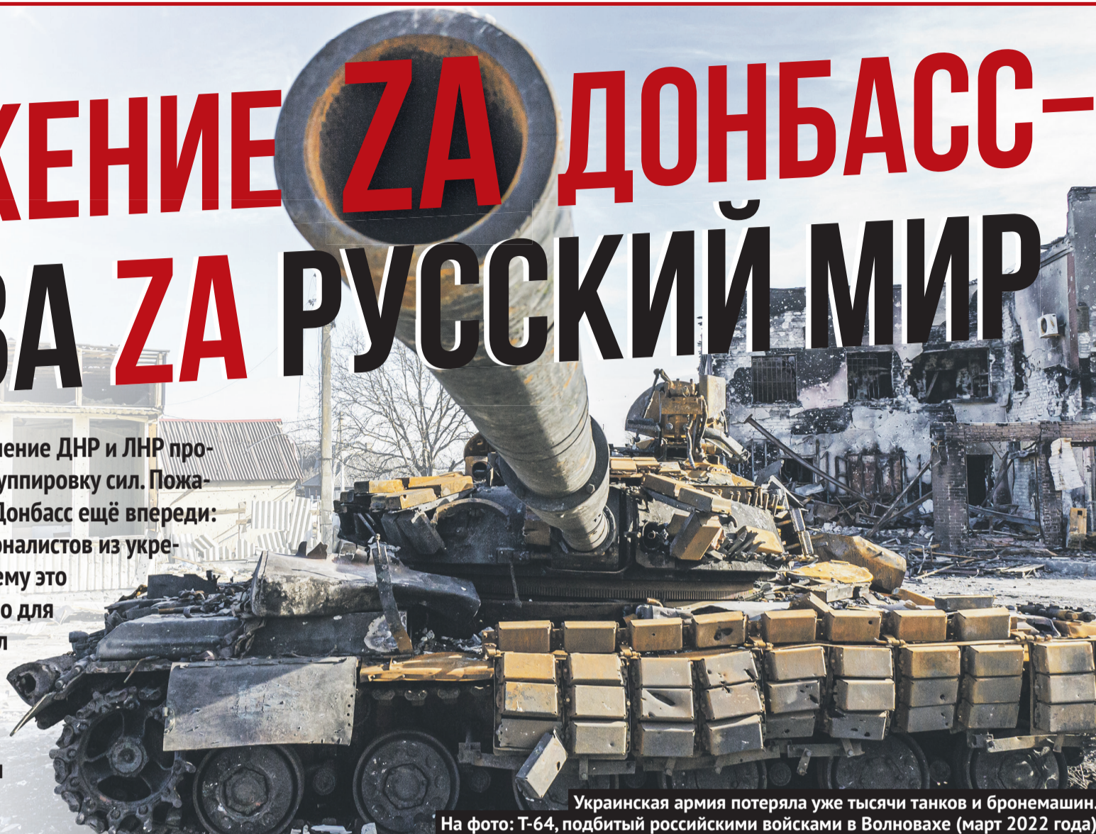
Украинская армия потеряла уже тысячи танков и бронемашин. На фото: Т-64, подбитый российскими войсками в Волновухе (март 2022 года)