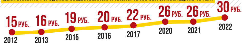
ЦЕНА БИЛЕТА В ГОРОДСКОМ ОБЩЕСТВЕННОМ ТРАНСПОРТЕ КИРОВА ЗА ПОСЛЕДНИЕ 10 ЛЕТ:

Коллективное письмо с просьбой помочь в адрес губернатора и Министерства образования области подписали 100 мам и пап особенных детей. Но в ответ пришла отписка – инициатива нецелесообразна, для обустройства школы нет здания, да и родители к властям якобы не обращались за помощью. Приложенные подписи чиновники «не заметили».