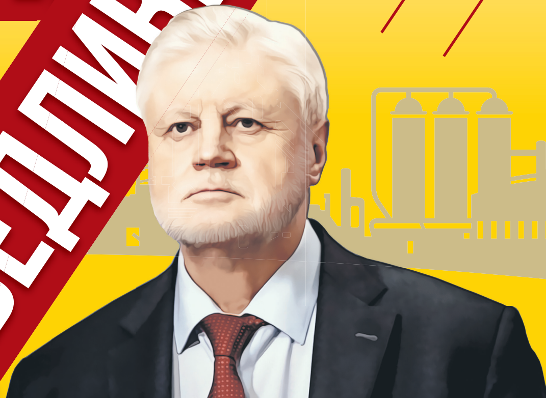
Фото: из архива Партии СРЗП, 123rf.com. Коллаж: Алексей Беленёв.

Как именно Кировская область может преодолеть последствия санкций?