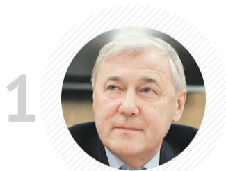
1 Комитет ГД по финансовому рынку АНАТОЛИЙ АКСАКОВ

ДЕПУТАТЫ ФРАКЦИИ «СПРАВЕДЛИВАЯ РОССИЯ – ЗА ПРАВДУ» ВОЗГЛАВИЛИ СЛЕДУЮЩИЕ КОМИТЕТЫ ГОСДУМЫ: