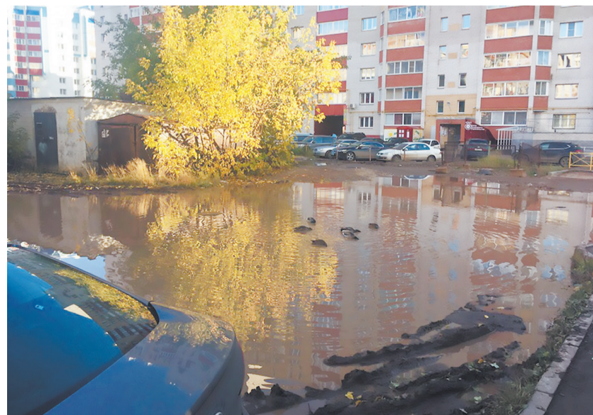
Город Киров, ул. Стахановская и ул. Орджоникидзе, 3

А пока жители ждут ремонта многострадальных дорог, они уже не в первый раз закупают щебень и засыпают ямы и лужи, в которых с приходом весны вновь успели поселиться утки, самостоятельно.