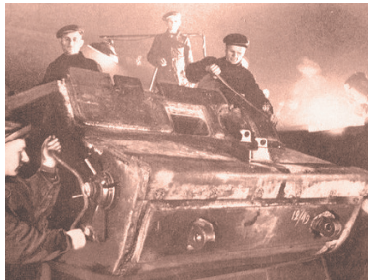
Ремонт танка на машиностроительном заводе имени 1 Мая.

Чтобы сэкономить время и начать выпуск продукции, оборудование устанавливали прямо на утрамбованную землю, даже не дожидаясь настила полов. Кузницу поставили под открытым небом: оградил фанерными щитами, подогнали два паровоза – отвели от них пар к