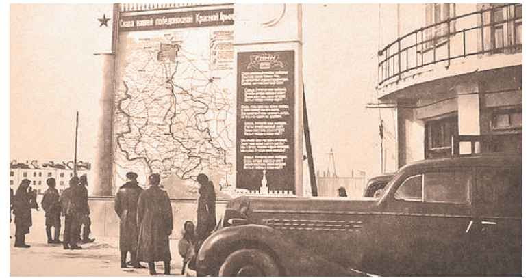
Карта военных действий на заводе имени Лепсе.

Труднее всего приходилось подросткам, не привыкшим к тяжелой нагрузке. Нина Вер-