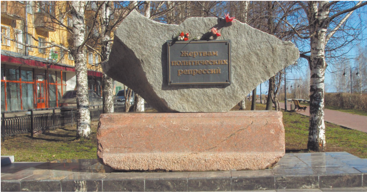
Памятник на набережной Грина в Кирове

я за тобой!» Когда открыли двери, то охранник, наверное, сжалился – и она на ходу выскочила. Поэтому дальше бабушка поехала в кайские леса с пятью детьми.