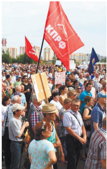
Митинг в Брянске.

По всей России люди выходили на акции с плакатами: «Пенсионная реформа – геноцид», «Хотим дожить до пенсии», «55 лет – и не минутой больше», «Вы лишаете нас пенсии – мы лишаем вас власти», «Пенсия для живых», «Мы не хотим умереть на работе».