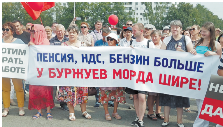
Митинг в Уфе.