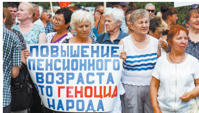
Митинг в Комсомольске-на-Амуре.

Отметим, что акции протеста проигнорировало государственное телевидение России. Репортажи о них не показал ни один государственный канал. Информационные агентства в своих сообщениях избегают употребления слова «реформа» и меняют его на «изменения пенсионного законодательства» или просто – на «пенсионные изменения».