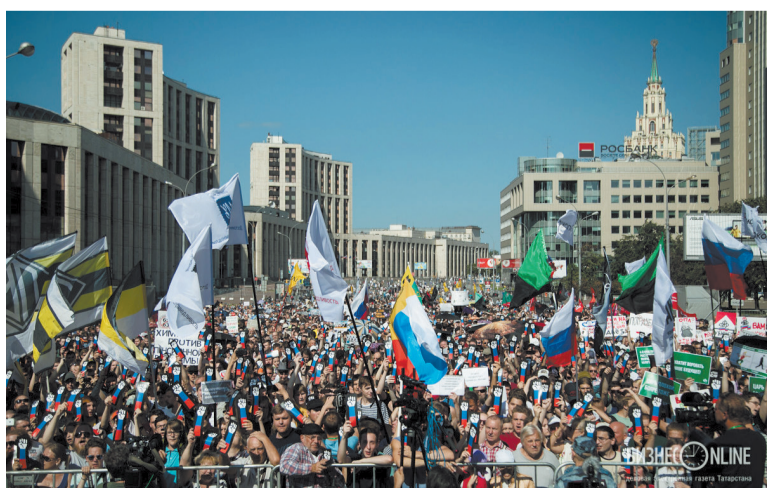
Митинг в Москве.