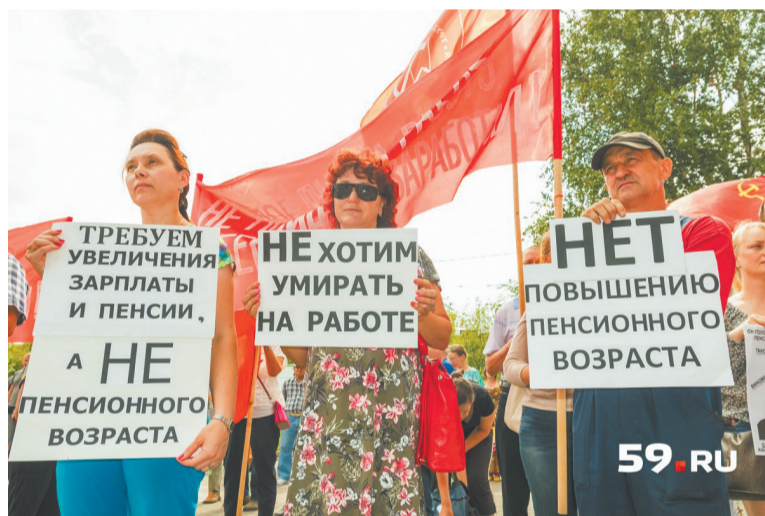
Митинг в Перми.

«Хотим дожить до пенсии», «55 лет – и не минутой больше», «Вы лишаете нас пенсии – мы лишаем вас власти», «Пенсия для живых», «Мы не хотим умереть на работе».