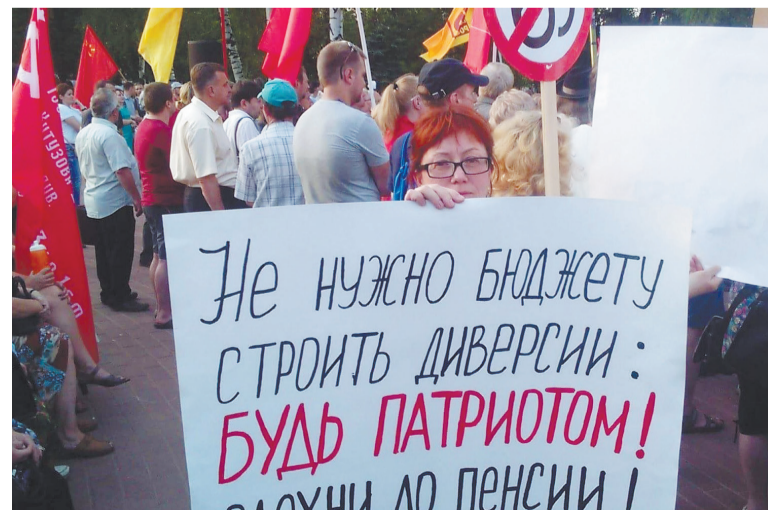
Митинг в Ярославле.

Меня удивляют положительные отзывы на Первом канале на пенсионную реформу от режиссеров, актеров, которые говорят, что они и в 70 лет на работу с удовольствием ходят. Но спросите тогда у людей труда, которые занимаются конкретно созданием внутреннего валового продукта, а не у тех, кто создают нам хорошее настроение. Это две разные вещи – работать в 70 лет артистом – и когда тебе 70 лет и ты лет 15 проработал в шахте, в сельском хозяйстве или на стройке. Я не видел еще ни одного человека труда, который сказал бы, что да, я за эту реформу.