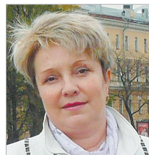
Депутат Думы Лальского городского поселения Лузского района (16 июня)