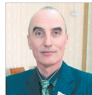
Депутат Городской Думы Советского района (19 июня)