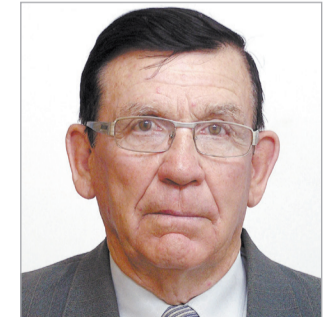
Председатель МО партии в Афанасьевском районе (27 июня)