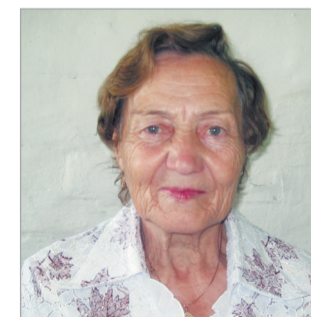
Председатель МО партии в Нагорском районе (22 апреля)