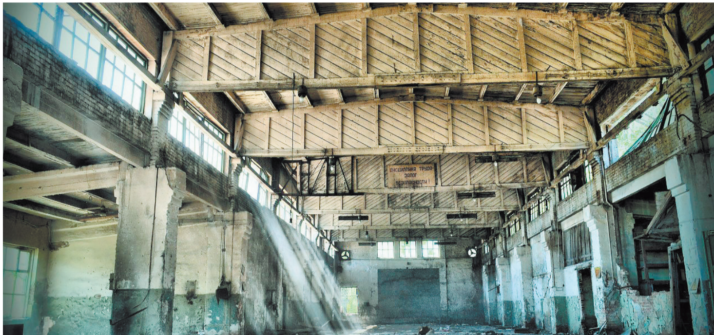
Завод железно-бетонных изделий и конструкций Северо-Кавказского Военного округа

За последние 10-15 лет в России закрылись и обанкротились тысячи предприятий, как промышленных, так и сельскохозяйственных. Это стало следствием не только разрухи 1990-х годов. Запустение продолжалось и в так называемые тучные годы, когда страна не вела масштабных военных операций, наращивала объёмы экспорта, а нефть стоила, как никогда, дорого. Однако Правительство не воспользовалось ситуацией. Какова истинная цена былой стабильности, читайте в нашем материале