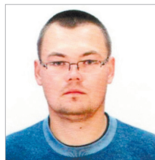
Глава Обуховского сельского поселения Пижанского района (18 апреля)