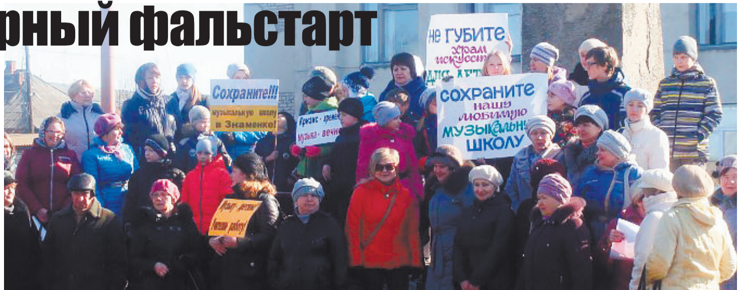
Из-за нехватки средств в Яранском районе уничтожается социальная инфраструктура. В марте 2015 года в Яранске прошел митинг против закрытия музыкальных школ