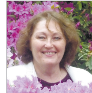
Депутат Косинской сельской Думы Зуевского района (29 апреля)